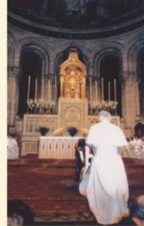
١ حزيران 1980: القديس يوحنا بولس الثاني