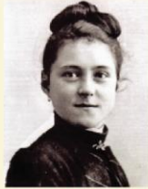
٦ تشرين الثاني 1887: القديسة تيريز دو ليزيو